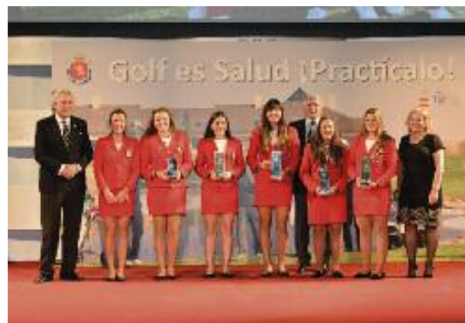
Triunfos Torneos Internacionales Femeninos