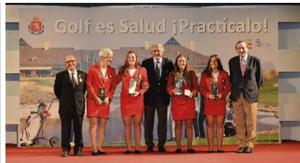
Mundial Junior Femenino