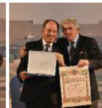
Placa al Mérito in Golf Aloha Golf