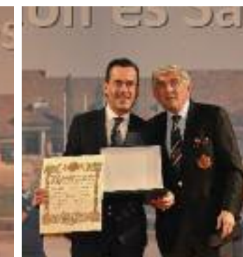
Placa al Mérito in Golf RCG La Herrería