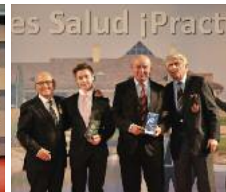
Triunfos Pitch & Putt