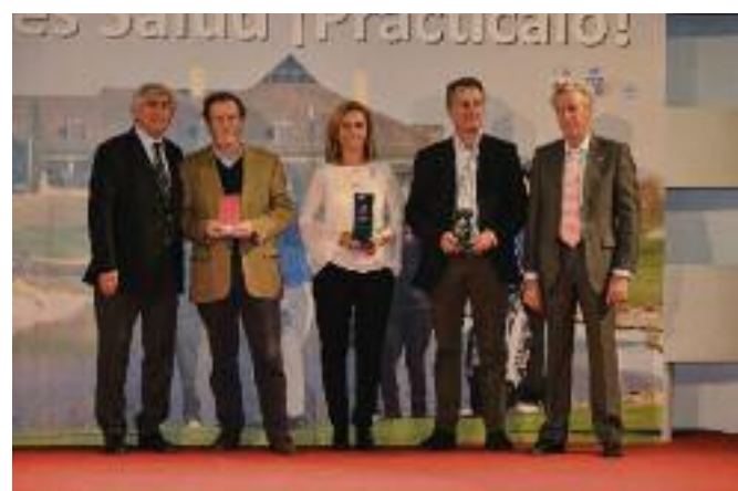
Triunfos Torneos Senior