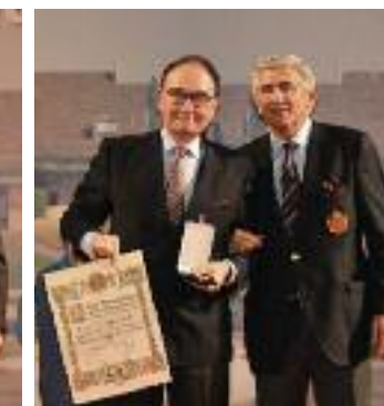
Medalla de Oro José Félix Bilbao