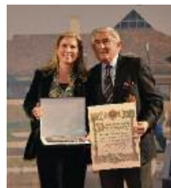
Placa al Mérito in Golf RCG Sevilla