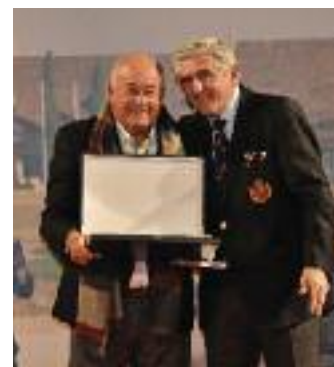
Placa Especial Ángel Gallardo