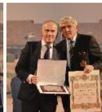
Placa al Mérito in Golf La Manga Club