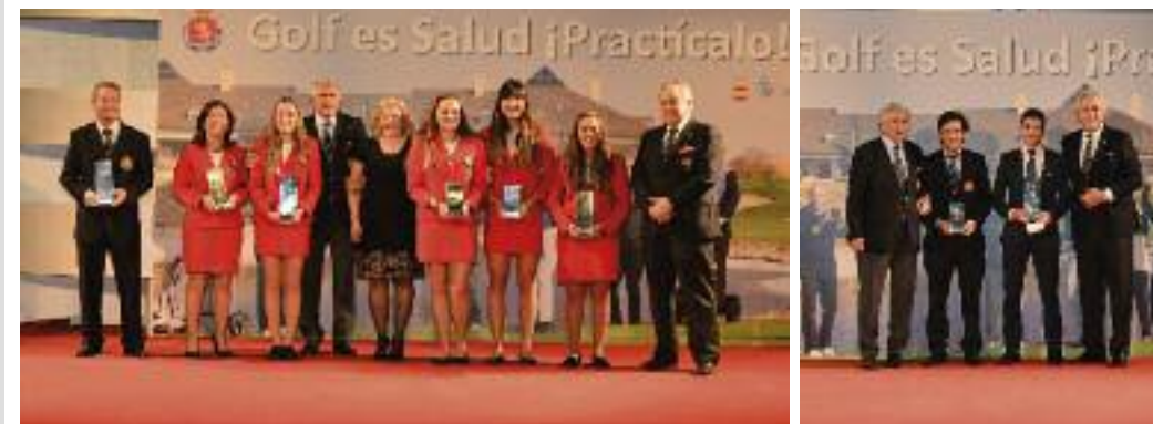
Europeo Absoluto por Equipos