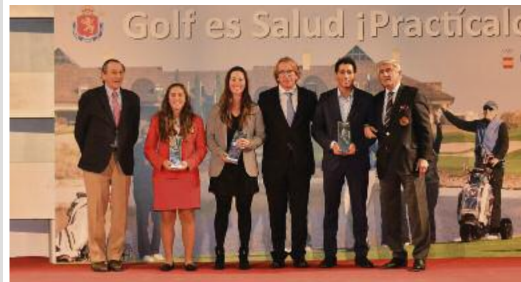
Triunfos Torneos Profesionales