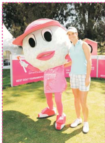
Birdy is the mascot of the European Nations Cup, a

friendly person with a huge golf ball head who is always plotting how to make less shots, without cheating of course. Birdy has arrived at La Sella and has made great friends with all the players from the different teams, establishing herself at the heart of the competition. This year she isn't able to represent Spain but who knows if in years to come Birdy may be able to partner Azahara Muñoz or María Hernández. She is training hard and learning from the best players in the world!