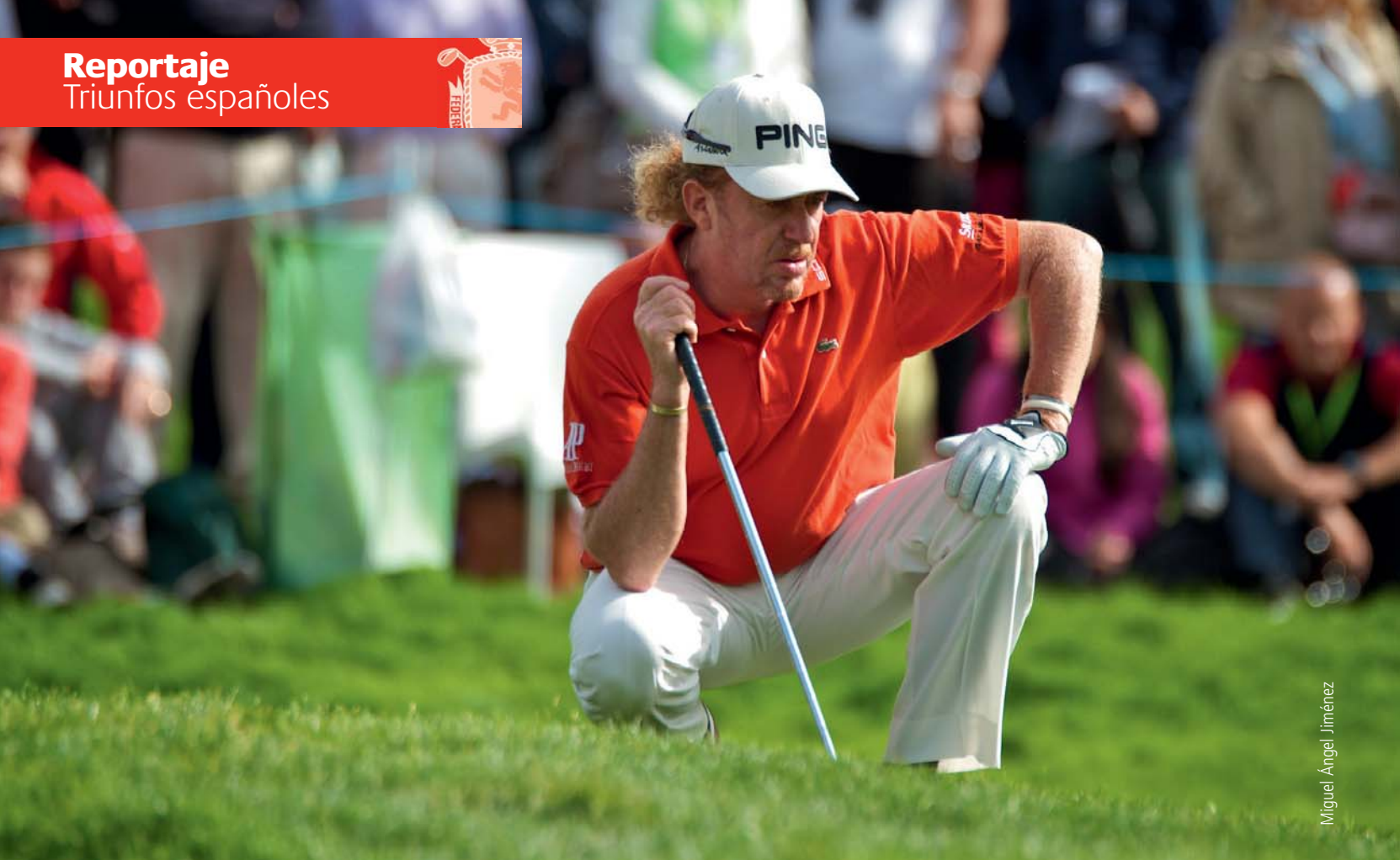
Miguel Ángel Jiménez