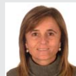
Presidenta Macarena Campomanes