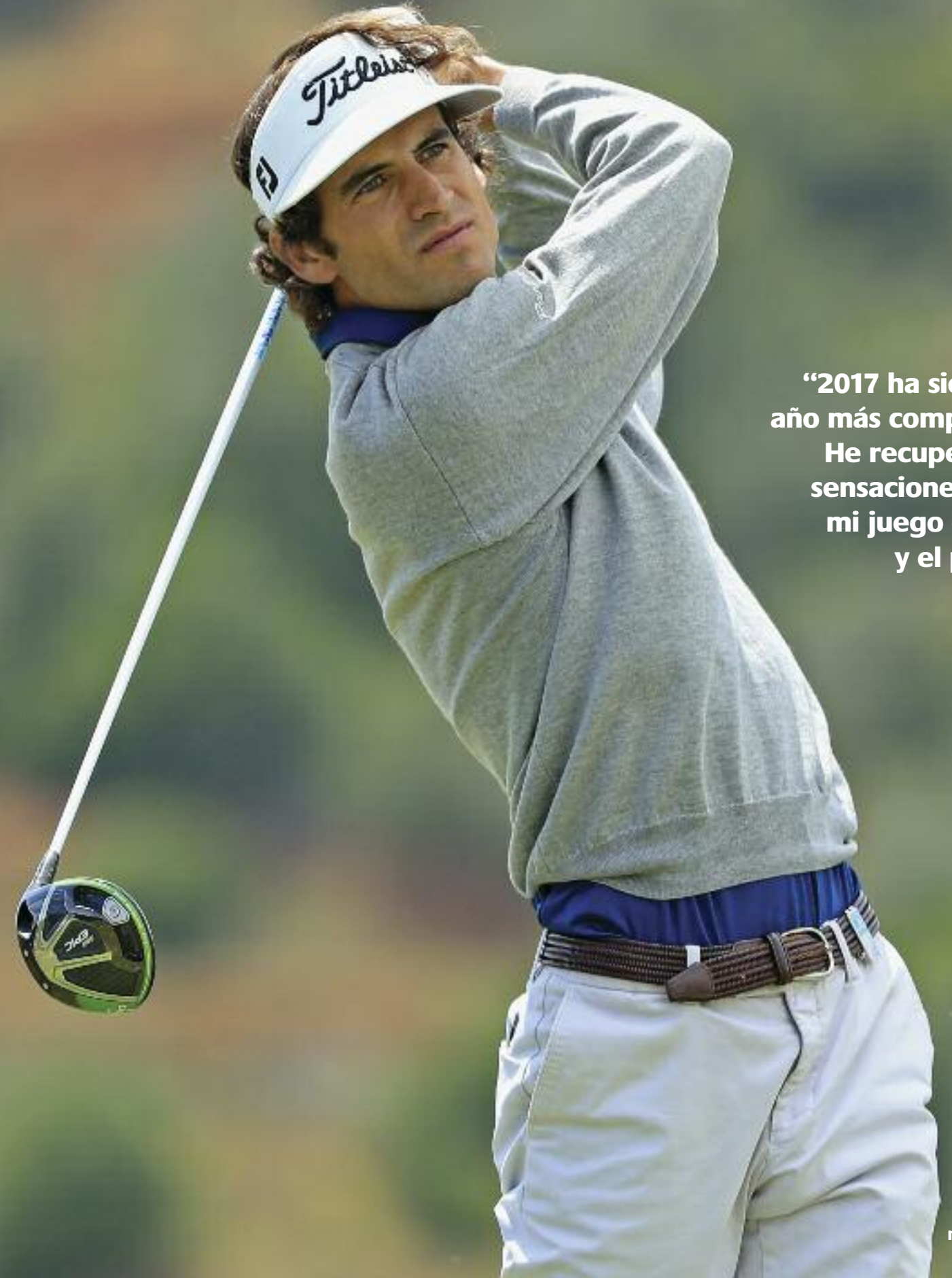
Por Jorge Villena

“2017 ha sido mi año más completo. He recuperado sensaciones con mi juego corto y el putt”